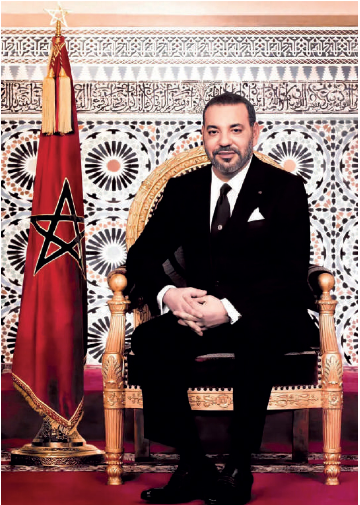
صَاحِبُ الْبِكْرِيَّةِ الْمَلِكُ مُحَمَّدُ السَّادِسُ بِصَلَاةِ اللَّهِ